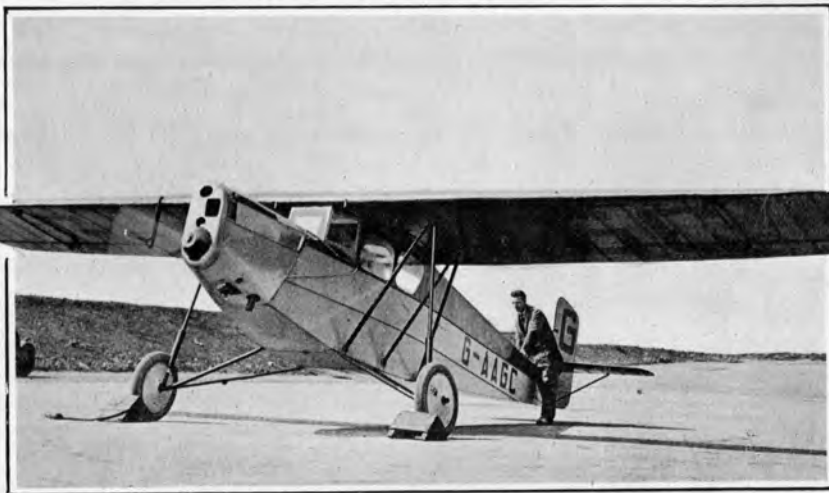
Le triplace DESOUTTER D. A. C.-3, à moteur CIRRUS III 85-95 HP.