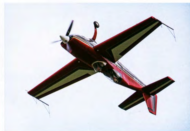
L'Extra 300 di Gerolamo Ghiringhelli con Sergio Dallon nell'abitacolo anteriore aperto, con il caratteristico canopy