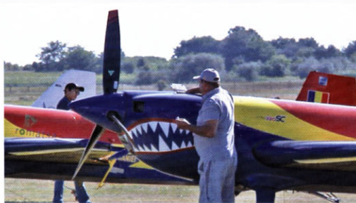
Sopra: un pilota si prepara alla gara simulando le figure del programma di volo e un altro pulisce l'aereo dopo la gara.