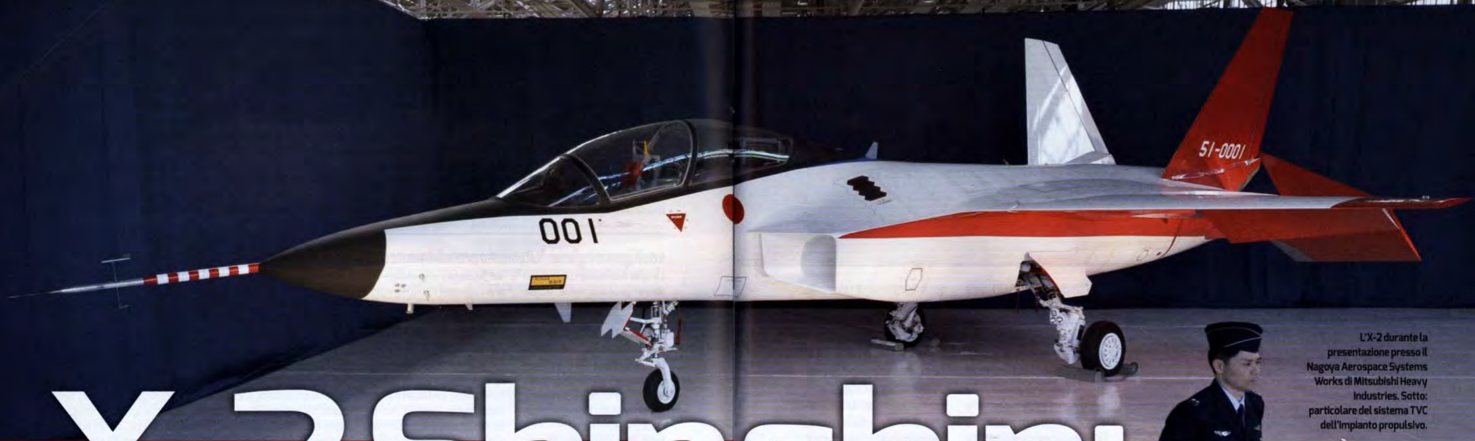
L'X-2 durante la presentazione presso il Nagoya Aerospace Systems Works di Mitsubishi Heavy Industries. Sotto: particolare del sistema TVC dell'impianto propulsivo.