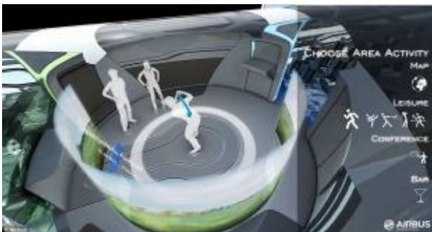
GOLF E TENNIS VIRTUALE A BORDO DEGLI AEREI