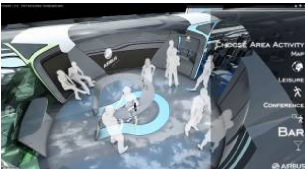
SPAZI DI SOCIALIZZAZIONE SUGLI AEREI DEL FUTURO

Le promesse della "Airbus" arrivano dopo una ricerca in cui si chiedeva ai viaggiatori cosa desiderassero per i vettori dell'avvenire. La risposta è stata: un volo che sembri una vacanza, dotato della tecnologia che si usa quotidianamente a terra.