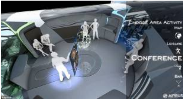
ZONE INCONTRO FRA STAFF E PASSEGGERI

Secondo la "Airbus" nel 2050 i posti dei passeggeri potranno fornire massaggi, bibite e vitamine, profumo di mare o di pino. Chi preferisce "vedere", potrà gestire i finestrini, all'occorrenza trasparenti o opachi. La vista a 360° svelerà le meraviglie della terra.